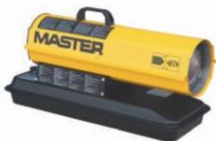
B 35 / B 70 CED