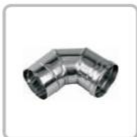
Koleno z nerezavějící oceli 90° Ø 120 mm (BV 77) - 4013.261 Ø 150 mm (BV 110-290) - 4013.247 Ø 200 mm (BV 470, BV 690) - 4013.248