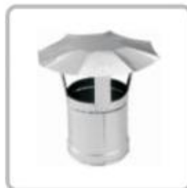
Vložka kominu z nerezavějící oceli Ø 120 mm (BV 77) - 4013.262 Ø 150 mm (BV 110-290) - 4013.249 Ø 200 mm (BV 470, BV 690) - 4013.250