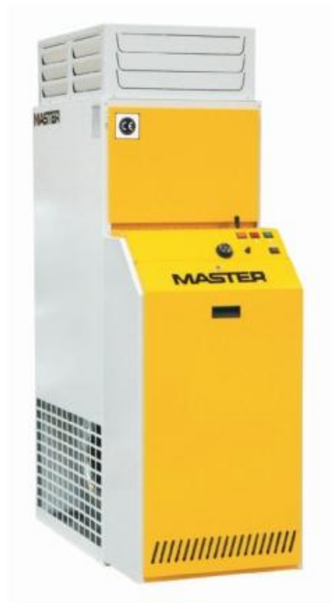
BF 35 – 105