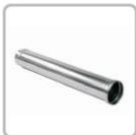
Výfukové potrubí z nerezavějící oceli Ø 120 mm, 1 m (BV 77) - 4013.260 Ø 150 mm, 1 m (BV 110-290) - 4013.243 Ø 200 mm, 1 m (BV 470, BV 690) - 4013.245