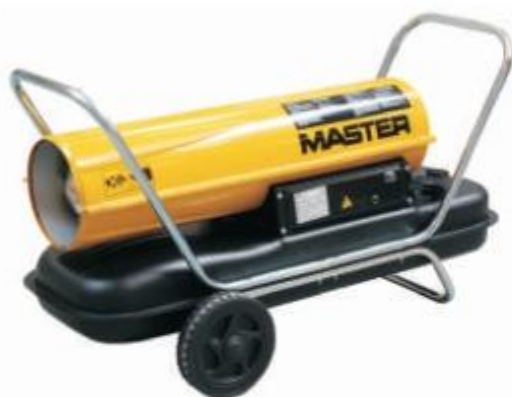
B 100 / B 150 CED