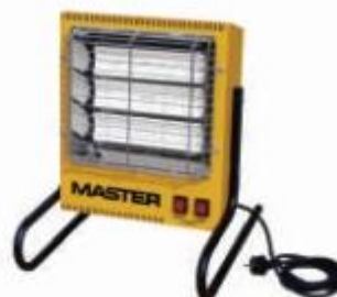
TS 3 A