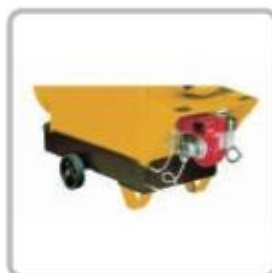
Palivová nádrž pro AIRBUS BV 470 - 4514.098 - 135 l