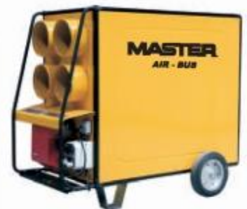
BV 470/690 FS