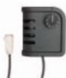
Pokojevý termostat TH 5 se kabelem. Rozsah: 0-36°C Citlivost: ± 1,5°C 4150.105