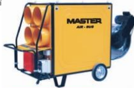
BV 470 FSR