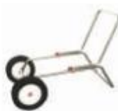
Podvozek B35, B70 4103.925