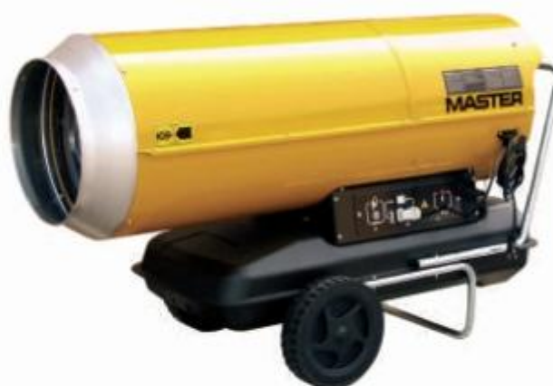
B 230 / B 360