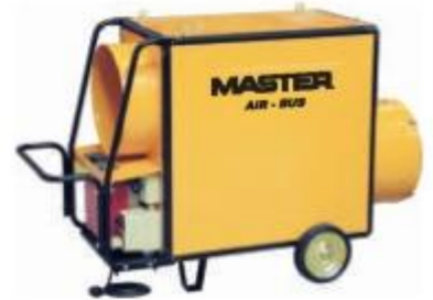
BV 310 FS