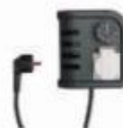
Pokojový termostat TH 2 se kabelem. Rozsah: 0-36°C Citlivost: ± 1,5°C 4100.426