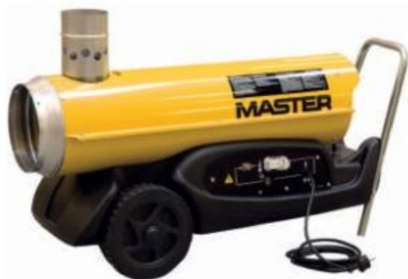
BV 77 E