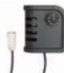
Pokojev termostat TH 5 se kabelem. Rozsah: 0-36°C Citlivost: ± 1,5°C 4150.105