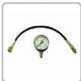
Manometr 0-0,6 bar - B35, B70, B100, B150 - 4109.427 0-16 bar - pro vysokotlaké modely - 4109.435