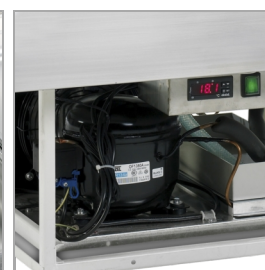
Automatické odpařování vody po odmrazení